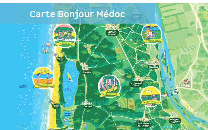
Carte Bonjour Médoc