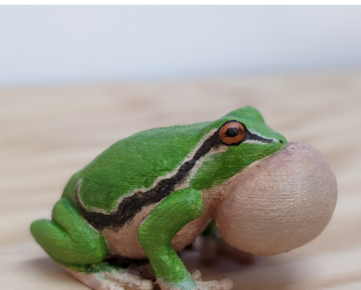
Rainette verte 1 disponible

Ces reproductions permettent d'observer de près les caractéristiques d'animaux emblématiques du territoire mais aussi de comparer les espèces entre elles pour comprendre leurs caractéristiques.