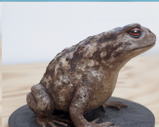
Crapaud épineux 1 disponible