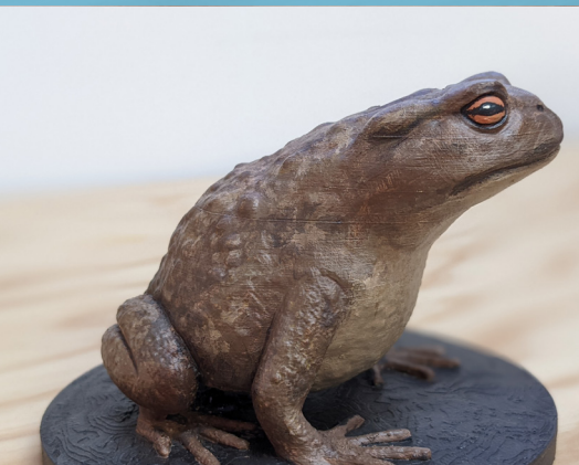
Crapaud commun 1 disponible