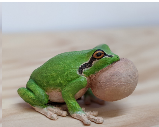
Rainette méridionale 1 disponible