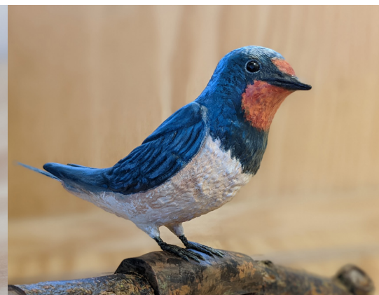
Hirondelle rustique 1 disponible