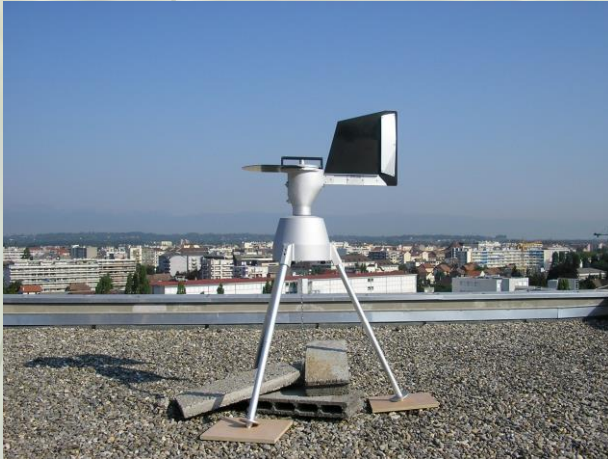
Capteur RNSA