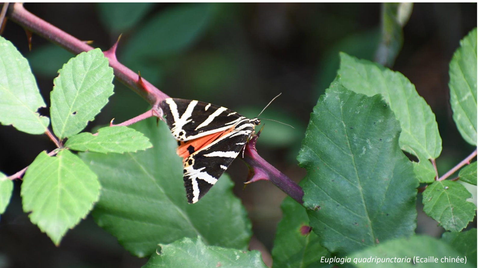
Euplagia quadripunctaria (Ecaille chinée)

Le chargé de mission présente également les participants qui suivent la réunion à distance en visio-conférence et rappelle l'ordre du jour.