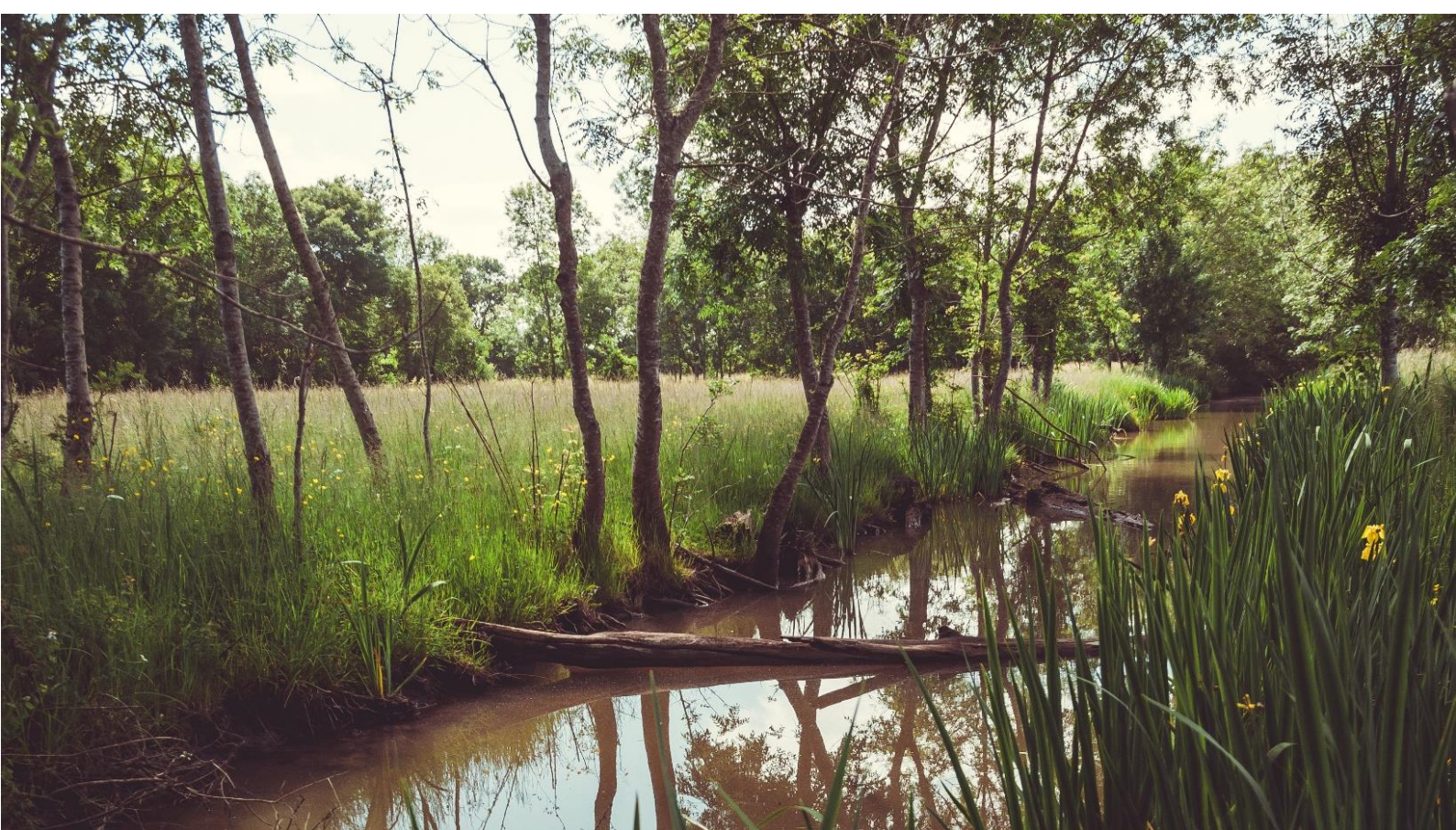
Marais de Troussas - Prairie du Château de Lassus