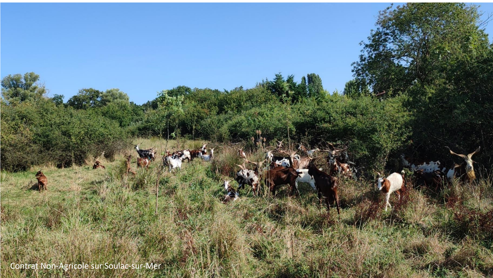
Contrat Non-Agricole sur Soulac-sur-Mer